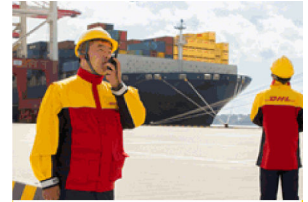
DHL グローバル フォワーディング ジャパン株式会社

モロッコでは今年1月、ジブラルタル海峡に面するタンジェ港、タンジェ・フリーゾーン、タンジェ・オートモーティブシティ、ケントラ輸出フリーゾーン(通称=アトランティックフリーゾーン)およびカサブランカ近郊ヌアサーの航空産業ゾーンを調査した。道路事情に問題はなく、また、タンジェ港ではKPI(重要業績指標)として1時間当たりの荷役量として35TEUを掲げているとした。